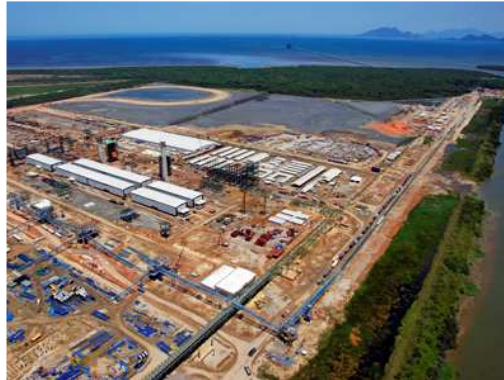
Stahlwerk-Baustelle Sepetiba Bay